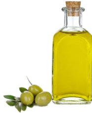
Aceite de oliva