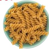
Pasta de trigo integral