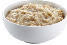
Avena y avena integral